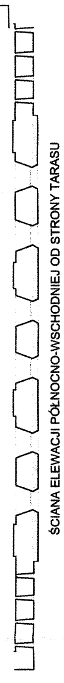
SCIANA ELEWACJI PÓŁNOCNO-WSCHODNIEJ OD STRONY TARASU